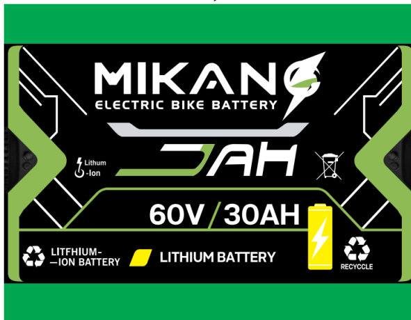
Kt Tem: D15,5 x C12 cm